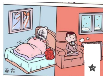
南北差异的概述图（1张）

南轻北重。由于受到资源和区位等因素的影响，中国的工业布局有南轻北重的地域特征，即中国北方以重工业为主，南方轻工业相对比较发达。造成这一现象的原因主要是：中国北方煤炭、石油、铁矿石等矿产资源丰富，因而逐渐形成以采矿、冶金、机械制造等重工业为主的工业结构。而中国南方多稀有金属、贵金属和有色金属等高端工业原料，但缺少煤炭、石油等基础工业原材料，而南方资金技术力量雄厚，所以选择发展原料、燃料消耗少的工业类型，因而轻工业相对比较发达。