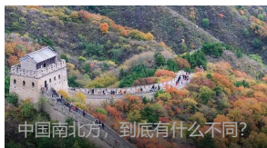
中国南北方，到底有什么不同？

中国有960万平方千米的陆地，和300万平方千米的海洋，在如此广袤辽阔的疆土上，地域差异总是永恒的话题。而其中