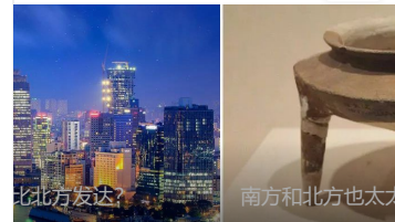
多亿美元的经济总量 其原因是南方气候湿润，北方仅占三分之一... 北方网友发? 南方和北方也太太