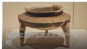
南方和北方也太大大不一样了吧

2019年，在越南2600多亿美元的经济总量中，南部占了三分之二，北方仅占三分之一。越南人口分布上也是南多北少。